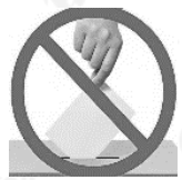
Anuló su voto