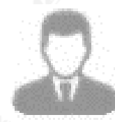
Candidato no registrado